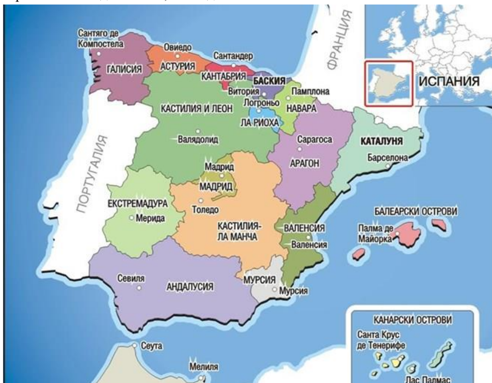
Фиг. 1. Административна карта на Испания

Каталуния е сходна по културно-етнически различия с Баския. Нарастващият национализъм в тази автономна област доведе до искане за провеждане на референдум през втората половина на 2017 г., засега забранен от държавните власти. От 2006 г. Каталуния (Каталуня) има свой специален статут. Това и предопределя най-голямата автономия на територия в историята на Испания. На практика е държава в държавата. В конституцията на страната е записано, че каталунците са нация. Това естествено отрицтва стимули за формиране на нова, собствена национална държава с нови етнически граници. Това е и най-богатата територия на страната. Дава над 20% Брутният вътрешен продукт (БВП) на Испания. Това създава усещане у каталунците, че те „издържат“ останалата испанска територия. Това генерира протести на недоволство, последните от които са от есента на 2019 г.