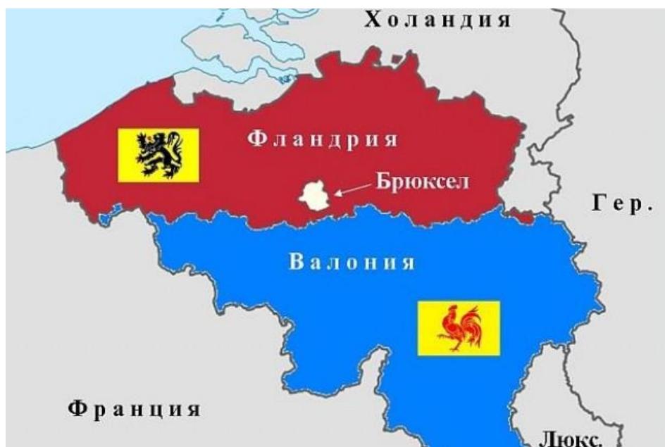
Фиг. 2. Историко-географски области Фландрия и Валония в Белгия.

Белгия. Населението на Белгия е съставено основно от две етнически групи: фламандци , които говорят холандски и валонци , които говорят френски. Въпреки езиковата непоносимост причината за разделението е историческа. Във времето са се облагодетелствали предимно френскоговорящите общности във Валония, а фламандците, които залагали предимно на селското стопанство и били мнозинство в страната, останали в неизгодно икономическо и политическо положение. Недоволството на фламандците от снизходителното отношение на валонците, които ги смятали за по-нисши в културно отношение, помогнало за развитието на фламандския национализъм. Днес всяка от областите иска независимост. Във всяка от тях няма да сте „добре дошъл“ ако говорите езика на „врага“.